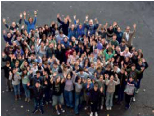
Konfi-Freizeit in Miltenberg