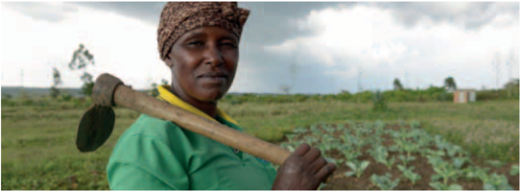
v.l.: Foto zur 66. Aktion von Brot für die Welt