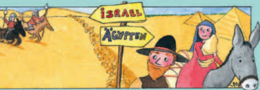
Aufnahme im Engel.

aus der christlichen Kinderzeitschrift Benjamin