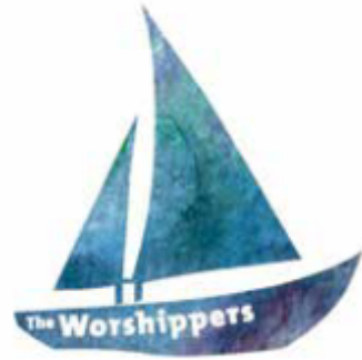
Logo der Band „The Worshippers“