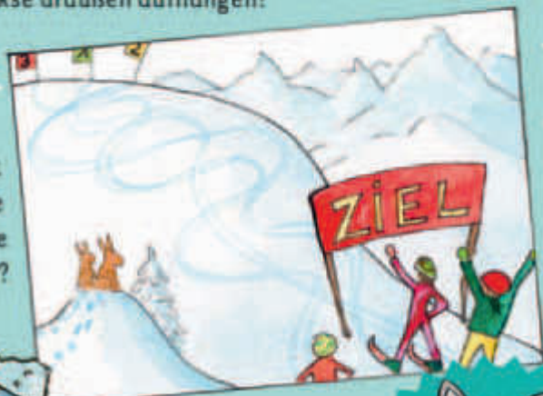
Der Skifahrer mit der Startnummer 1.

Rätsel: Wer ist im Rennen die kürzeste Strecke gefahren?